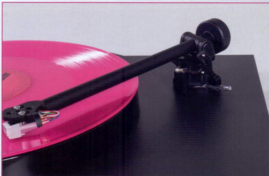
Der Planar 1 ist mit dem Rega eigenen Carbon MM-Tonabnehmer ausgestattet. Zudem ist der Tonarm für ihn optimiert, wodurch er eine starke Performance abliefern

Ändert man die Lautstärke mit der Fernbedienung, dreht sich der Regler wie von Zauberhand. Der io verfügt über zwei Paar Cinch-Eingänge für Linesignale und eines für die integrierte MM-Phonostufe. Ausgangsseitig bietet der Rega io Amp Lautsprecherklemmen für ein Paar Lautsprecher. Das Anschluss-terminal des io ist so langlebig gefertigt, wie wir es von Rega kennen. Zur Fernsteuerung liegt dem kleinen Verstärker eine Fernbedienung bei. Diese fällt zwar etwas leicht aus, dennoch liegt sie gut in der Hand und ist intuitiv gestaltet. Die namentliche Ähnlichkeit des io zum Rega Verstärker Brio ist kein Zufall. Der io ist schließlich so etwas wie der kleine Bruder des Brio. Im Inneren des kleinformatigen Verstärkers verbirgt sich nämlich dieselbe Verstärkerstufe, wie sie auch der Brio nutzt. Dank dieser schafft der io eine Leistung von zweimal 30 Watt bei 8 Ohm. Beim Aufbauen des Rega io sind wir etwas überrascht. Das mitgelieferte Stromkabel ist für drei Pins ausgelegt, der io hat jedoch nur zwei, weshalb das Kabel einfach wieder aus dem Anschluss herausfällt. Zum Glück sind Kabel in verschiedensten Ausführungen und Formaten in der Redaktion eines HiFi-Magazins keine Mangelware und das passende Kabel ist schnell gefunden. Diese Unannehmlichkeit ist zwar unschön, be-