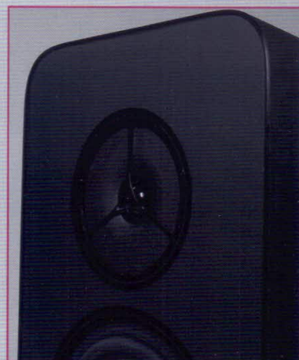
Der „Zero Rear Reflection“ Hochtöner strahlt nicht nach hinten, in das Gehäuse Innere ab, wodurch eine sehr saubere Klangwiedergabe möglich ist