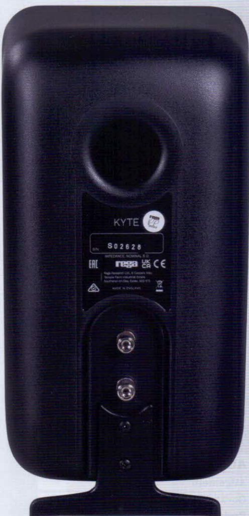
Unter den solide verarbeiteten Anschlussklemmen wird der etwas „rutschige“ Standfuß des Kyte montiert

voluminösen Grundton mit ordentlich Tiefgang mit sich, was wir von Lautsprechern dieser Größe nicht erwartet hätten. Die drei Komponenten formen eine sehr stimmige Synergie, in der sich die einzelnen Bestandteile gegenseitig besonders musikalisch in die Karten spielen. Das Klangbild ist sehr feinsinnig. Keine Frequenz fehlt oder klingt zu spitz. Die Performance der Kette ist stimmig und perfekt aufeinander abgestimmt. Als Kette klingen die einzelnen Bestandteile des System One einfach toll. Doch wie verhält sich die Kette mit anderen Eingangssignalen? Um das herauszufinden, schließen wir den CXN Streamer von Cambridge Audio an das zweite Cinchpaar des io Verstärkers an und streamen über die Tidal Connect-Funktion das Signal vom Smartphone. Wir hören das im Februar dieses Jahres erschienene