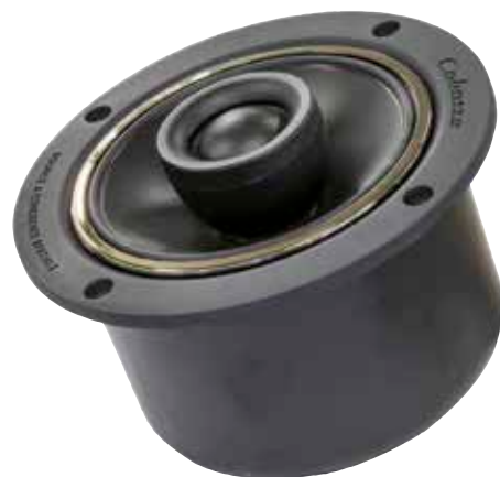
▲ Das Zwei-Wege-Koaxialchassis ist der Star dieser Cabasse-Konstruktion.

Für 1100 Euro ist die zudem recht aufstellungskritische Box damit ein klarer Preistipp.